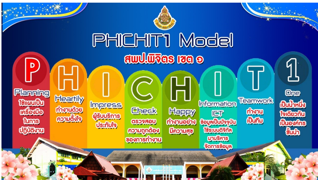
PHICHIT1 Model สพพ.พิจิตร เขต 1

กลุ่มอำนวยการของสำนักงานเขตพื้นที่การศึกษาประถมศึกษาพิจิตร เขต 1 เป็นกลุ่มที่เกี่ยวข้องกับการจัดระบบบริหารองค์การ การประสานงานและให้บริการ สนับสนุน ส่งเสริม ให้กลุ่มภารกิจและงานต่างๆ ในสำนักงานเขตพื้นที่การศึกษา สามารถบริหารจัดการและดำเนินงานตามบทบาทภารกิจอำนาจหน้าที่ ได้อย่างเรียบร้อย มีประสิทธิภาพและประสิทธิผลบนพื้นฐานของความถูกต้องและโปร่งใส ตลอดจนสนับสนุนและให้บริการข้อมูลข่าวสาร เอกสาร สื่อ อุปกรณ์ทางการศึกษาและทรัพยากรที่ใช้ในการจัดการศึกษาแก่สถานศึกษาเพื่อให้สถานศึกษาบริหารจัดการได้อย่างสะดวก คล่องตัว มีคุณภาพ ประสิทธิภาพ ประสิทธิผล และดำเนินงานตามนโยบายของผู้อำนวยการสำนักงานเขตพื้นที่การศึกษาประถมศึกษาพิจิตร เขต 1 ภายใต้วัฒนธรรมองค์กรของ สพพ.พิจิตร เขต 1 “ยิ้มแย้ม ทักทาย ใส่ใจ ให้บริการ”